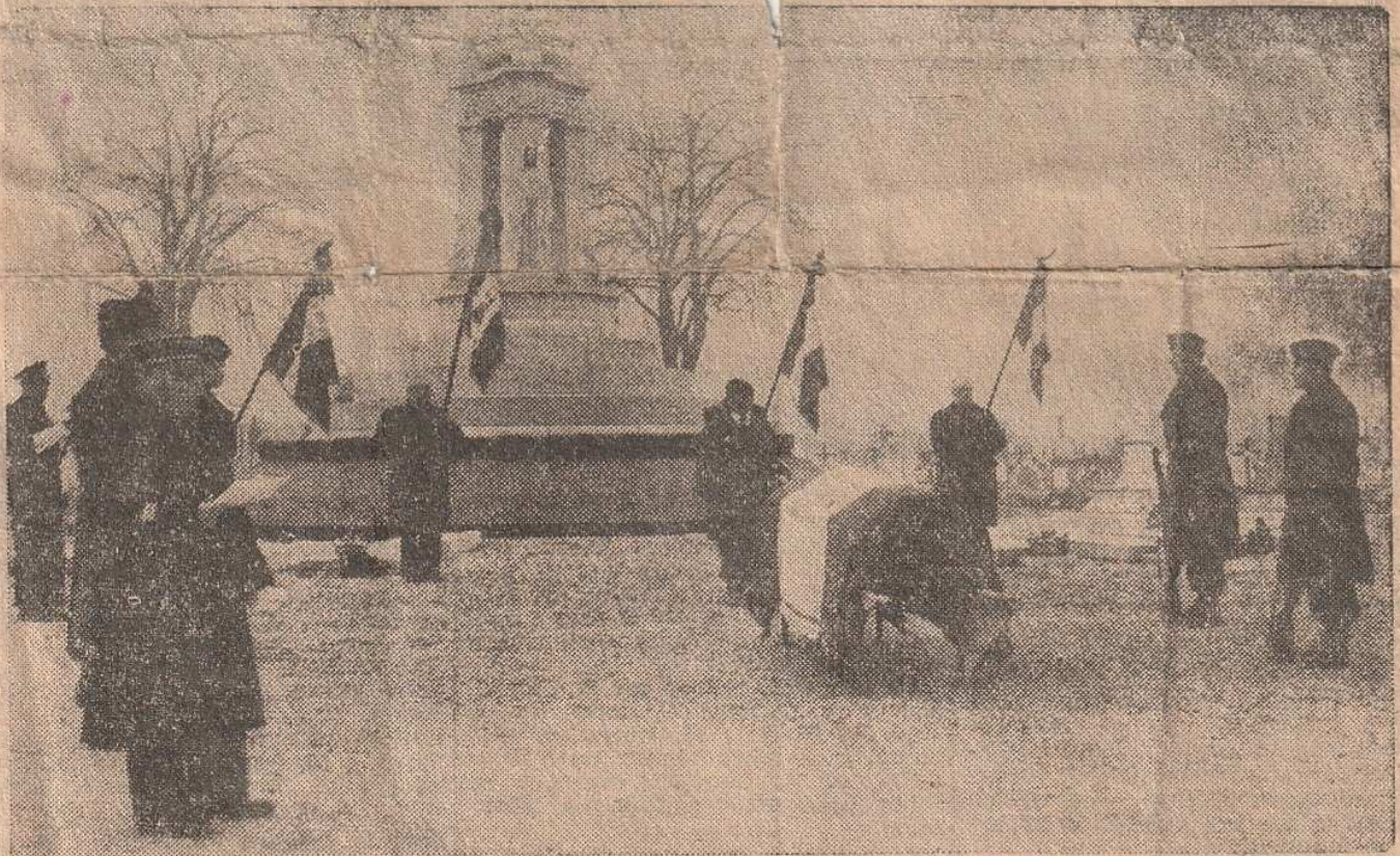
Au cimetière pendant le dernier adieu du colonel Delpy